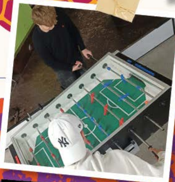
move for fun: Schlechtwetterprogramm indoor