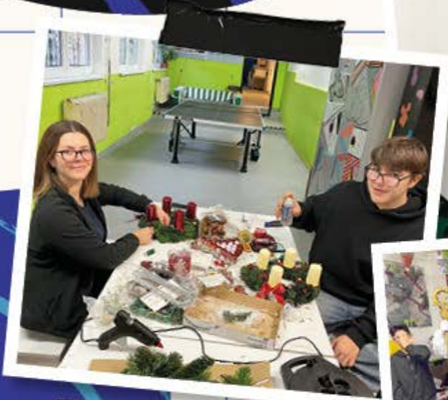
Adventkranz selbst gestaltet