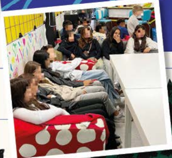
Neugier wecken, Vertrauen aufbauen - Schulbesuch der ersten Klassen