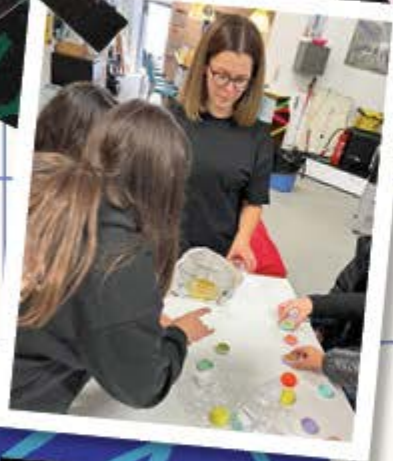
Lippenpflege selbst gemacht