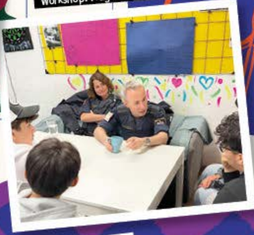
Workshop: Frag die Polizei