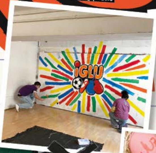
Kunst statt Spiegel – Renovierungsarbeiten als partizipativer Gestaltungsprozess