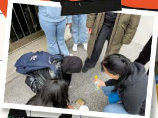
Niemals vergessen – Stolpersteine reinigen zum Tag gegen Rassismus