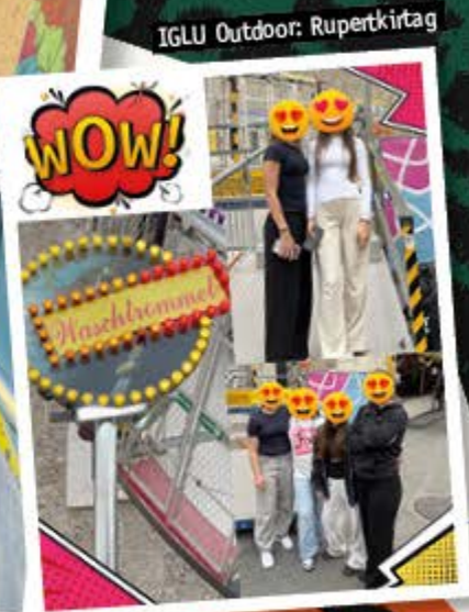
IGLU Outdoor: Rupertkirtag