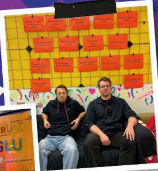
Aktion 16 Tage gegen Gewalt an Frauen