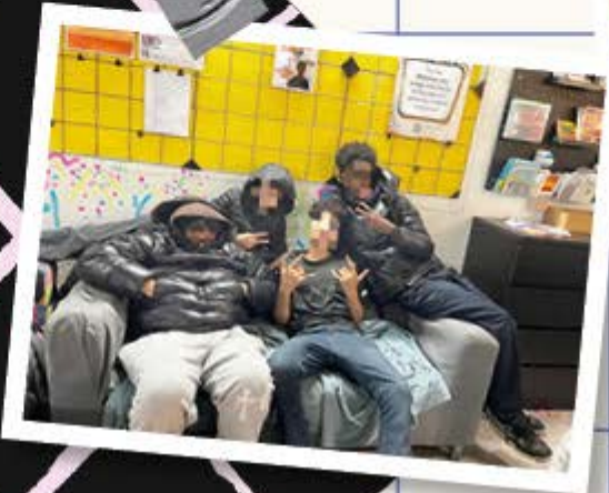
BroTalk: Austausch, Gemeinschaft und ehrliche Gespräche unter Burschen