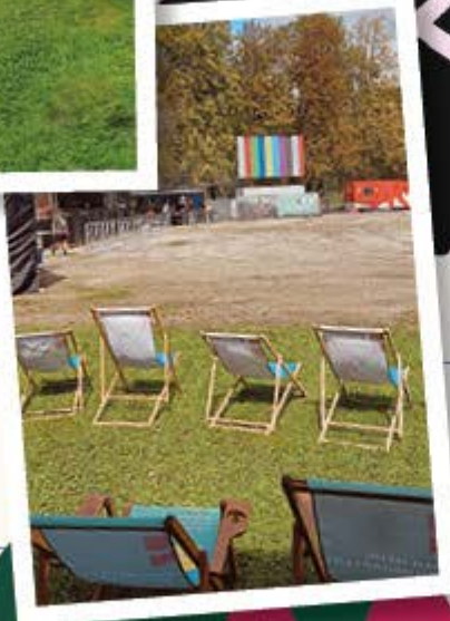
Steusalz bei Live in Salzburg dabei.