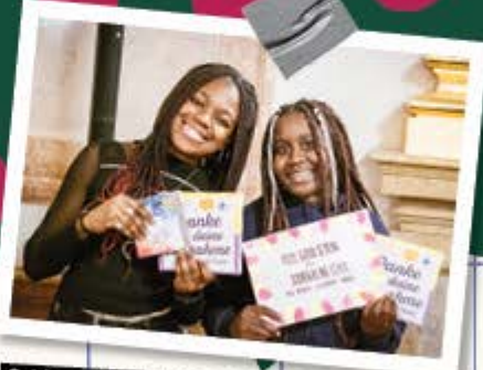
Schloss Mirabel: Preisverleihung Fotowettbewerb