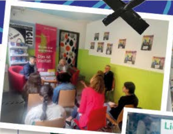
a Girls World : Make up & Pflege