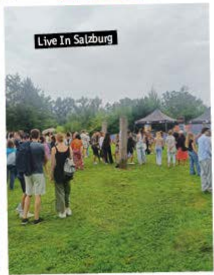
Live In Salzburg