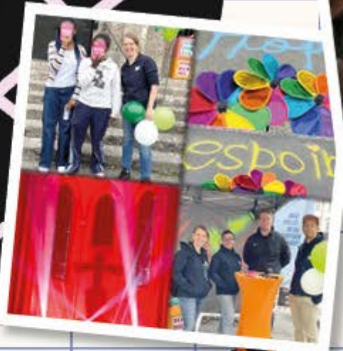
Lange Nacht der Kirchen