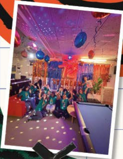
72 Stunden ohne Kompromiss