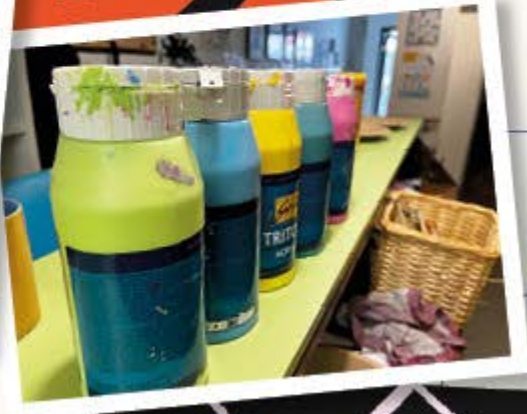
Bei uns gehts immer bunt zu