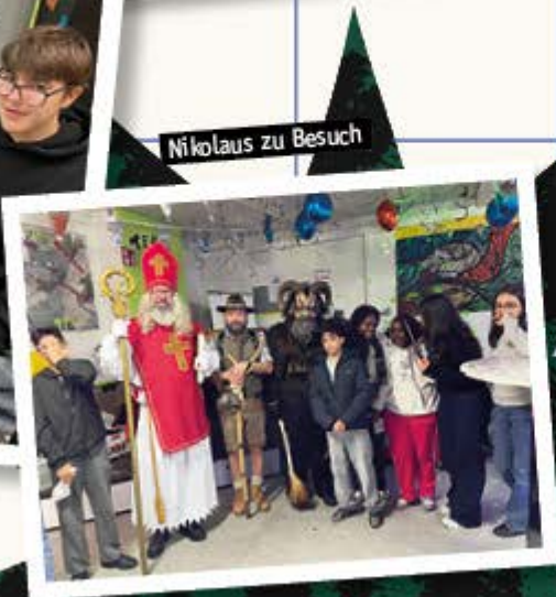
Nikolaus zu Besuch