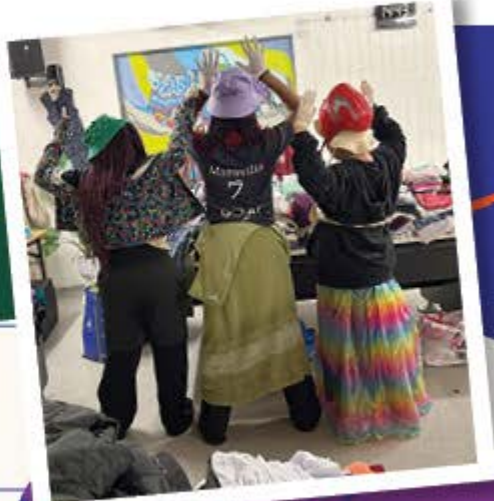
Kost nix Laden: finale Ausgabe