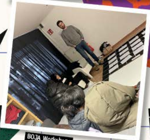
BOJA Workshop: Radikalisierung-Prävention