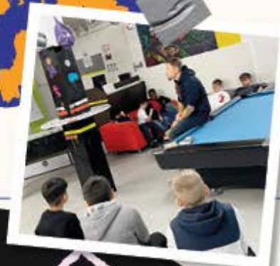
Neugier wecken, Vertrauen aufbauen - Schulbesuch der ersten Klassen