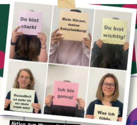
Aktion zum WomensHealthDay