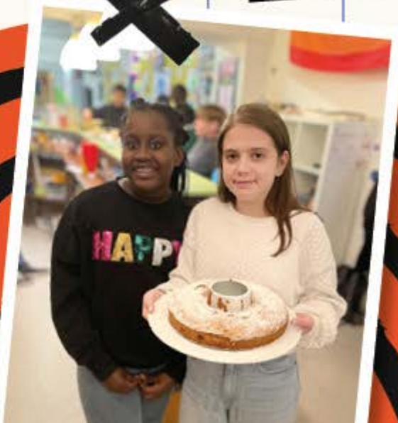
Gemeinsam etwas schaffen, Kochen und Backen als sozialer Erfahrungsraum