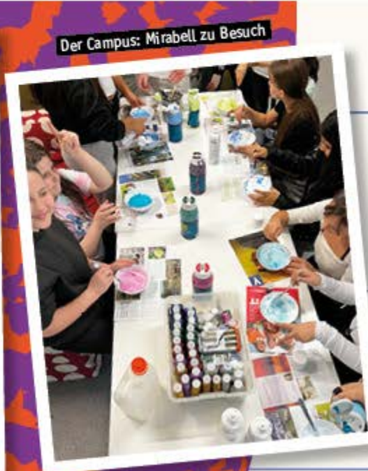
Der Campus: Mirabell zu Besuch