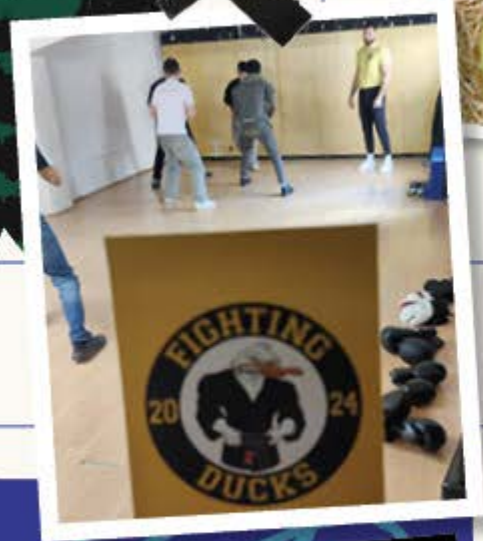
Selbstwahrnehmung und Verantwortung fördern – Gewaltpräventions-Workshop mit den Fighting Ducks