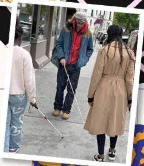
Inklusionsbotschaft zu Besuch