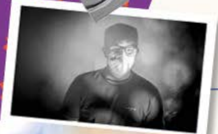
Fotoworkshop: Mein Recht auf Gesundheit und Wohlbefinden